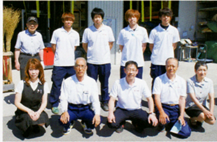
▲新入社員を迎えて活気ある職場のみなさん

同社の在庫はおよそ5000点。北見市近郊では屈指のアイテム数を誇ります。「ホームセンターにも売れ筋の商品は置いてありますが、プロの職人さんがたまにしか使わないよう