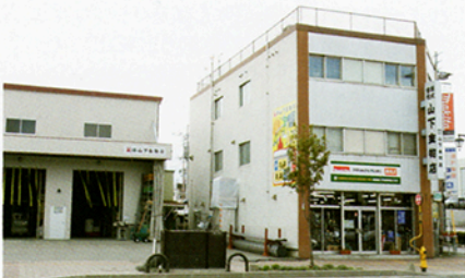
▲北見駅から徒歩約5分の便利な立地にあります

7月頃に船を貸し切り、社員を含めて総勢10名ほどでオホーツク海へ。毎回30~40cmほどのキレイをたくさん釣って帰ってきます。ちなみに私のこだわりは、手回りのリールです。周りの皆さんは電動リールを使っていますが、私はこの方が釣った達成感が味わえて好きですね。ただ、40~50mの海底から引き揚げるため、後半はいつものように筋肉痛で苦しめられています(笑)。